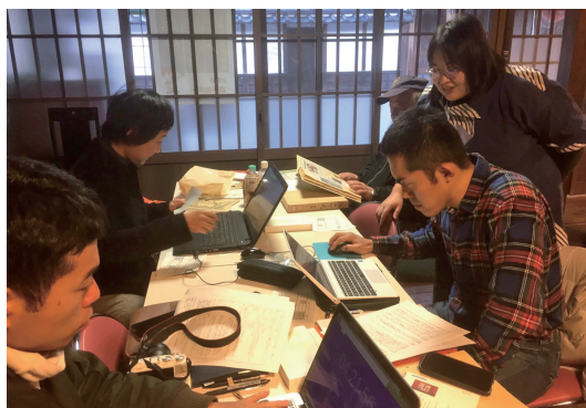
文献を調査しての記事作り風景

みんなでまち歩きをして、文献を調べ、ネット上の百科事典「ウィキペディア」に記事を書いていく。そんなイベント「勝山ペディア 2018」を実施しました。地元の人たち、移住者、老若男女。みんなでわいわいしながら、「勝山のお雛まつり」「勝山文化往来館ひしお」などのウィキペディアページを、ゼロから立ち上げました。素敵な記事ですので、ぜひ検索してください。(協力隊 甲田隊員)