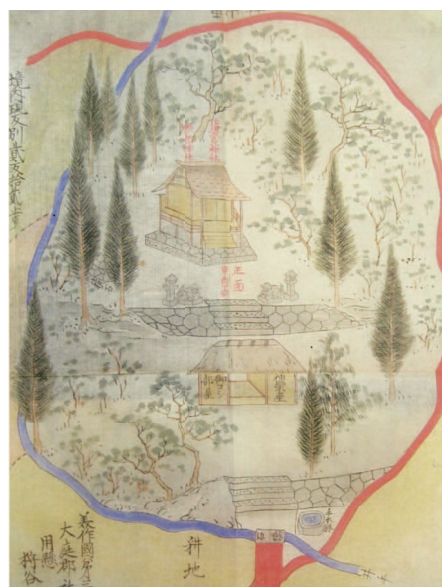
大社(佐波良・形部神社)

8社の参考史料(大社(1:佐波良・2:形部神社)、3:横見神社、二宮(4:長田、5:兎上、6:沓栗・7:大笹、8:久刀神社)) (引用元:「美作国布施社領の研究」より)