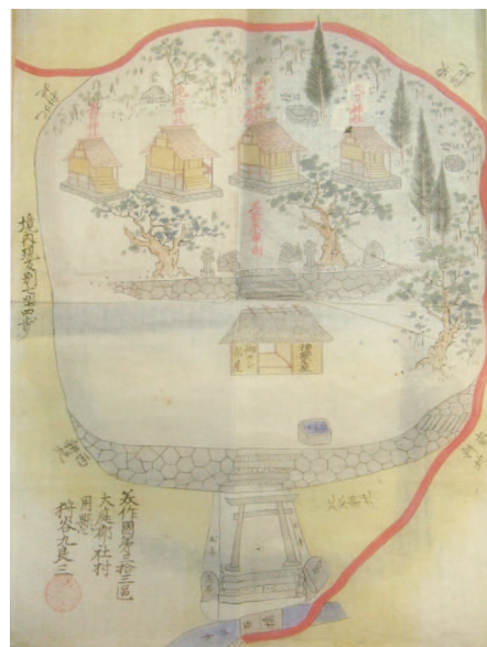
二宮(長田、兎上、沓栗・大笹、久刀神社)