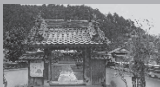
伊勢亀山藩陣屋門