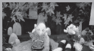
10月・カラクリ祭り