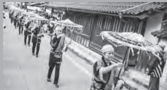
輿入れ道中での傘踊り行列