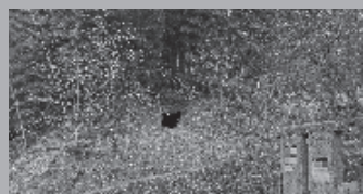
国指定史跡定古墳