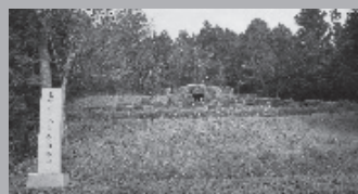
国指定史跡大谷古墳