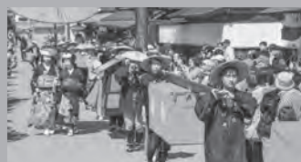
お籠による輿入道中