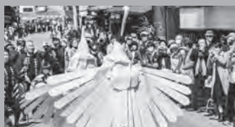
輿入れ道中前に行う「双鶴の舞」