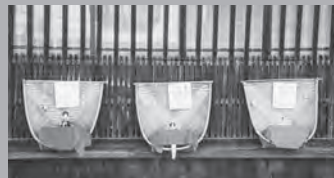
農具「箕」に飾った雛