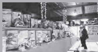
菅野邸に展示の古今雛