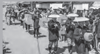
輿入れ道中先導役