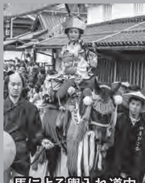
馬による輿入れ道中