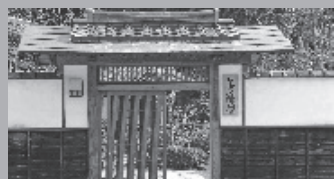
宿泊施設なかつい陣屋